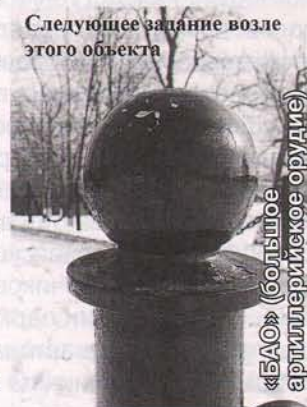
Следующее задание возле этого объекта

На составных частях зенитного орудия (лафет, зарядное устройство, прицельный механизм, колеса) нанесены цифры зеленого и красного цветов. Команде необходимо отыскать цифры своего цвета и найти сумму. Определив их последовательность, назвать недостающую цифру и прибавить к полученной ранее сумме. Данное число разделить на 15. Получившееся число и есть первый ключ.